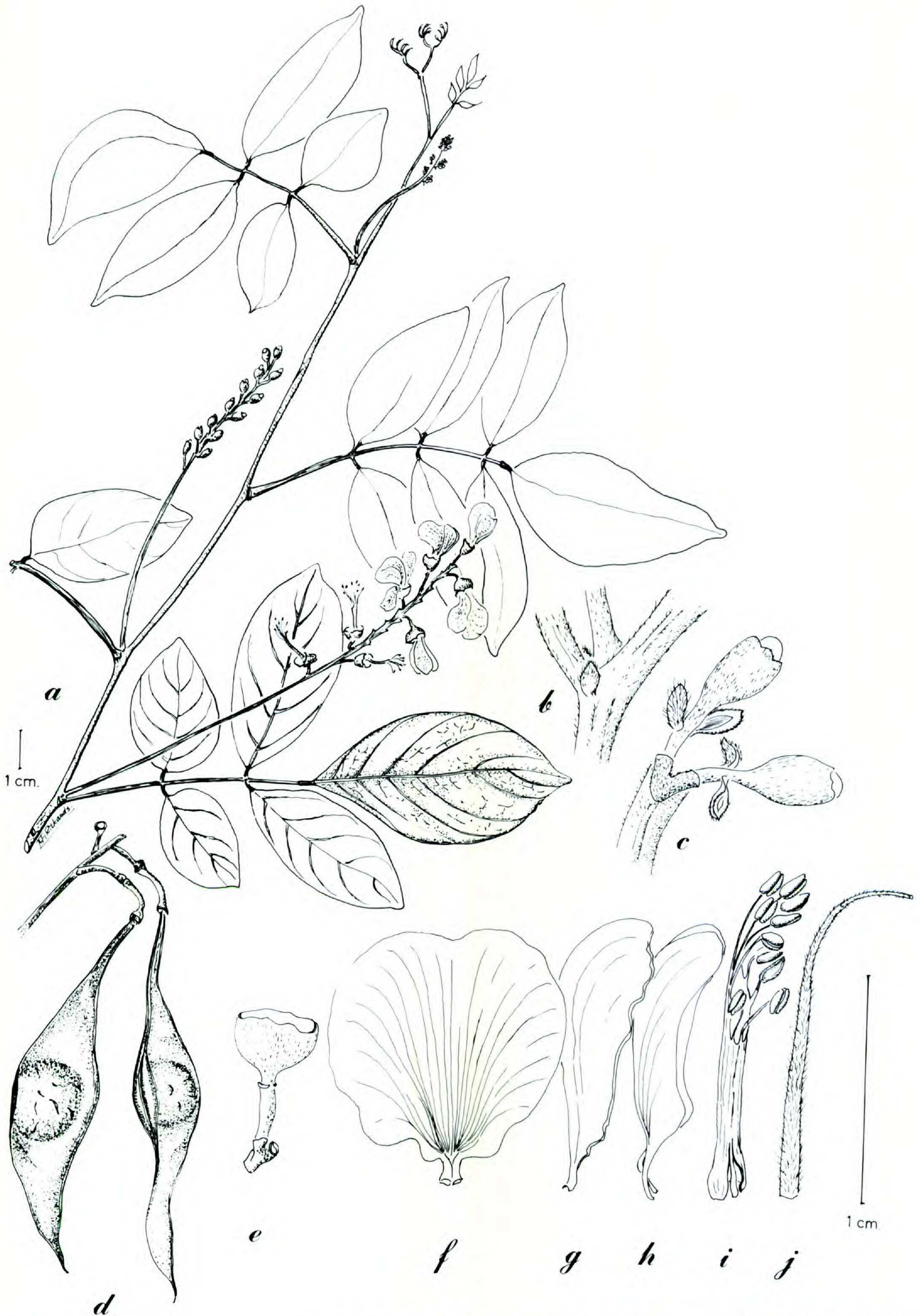
FIGURE 2. Lonchocarpus morenoi .—a. Rama con inflorescencias.—b. Estípula.—c. Botones florales, mostrándose las bracteolas.—d. Frutos, uno enseña el margen vexilar.—e. Cáliz con pedúnculo y pedicelo.—f. Estandarte.—g. Ala.—h. Quilla.—i. Tubo estaminal.—j. Gineceo. Las hojas y flores fueron tomadas de Moreno 8356 y los frutos de Moreno 2155.